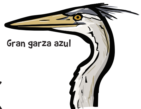
Gran garza azul