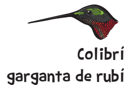
Colibrí garganta de rubí

LA SONDA: Esta diminuta ave usa su pico largo y estrecho para buscar profundamente en las flores y alimentarse de néctar.