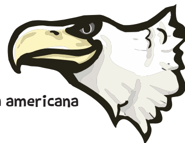
Águila calva americana